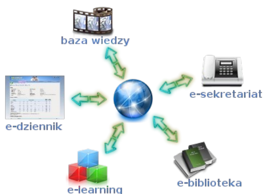
Schemat działania i elementy platformy oświatowej

2) stworzenie platformy oświatowej opartej o dziennik elektroniczny TopSzkoła.pl.